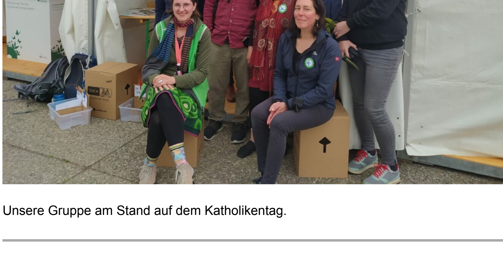
Unsere Gruppe am Stand auf dem Katholikentag.

Vom 25. bis 29. Mai waren wir auf dem Katholikentag in Stuttgart vertreten. An unserem Stand und bei mehreren Veranstaltungen erreichten wir ganz unterschiedliche Menschen, durften schöne Begegnungen erleben und konnten unsere Forderungen vorbringen. Einen ausführlichen Bericht vom Katholikentag gibt es auf unserem Blog .